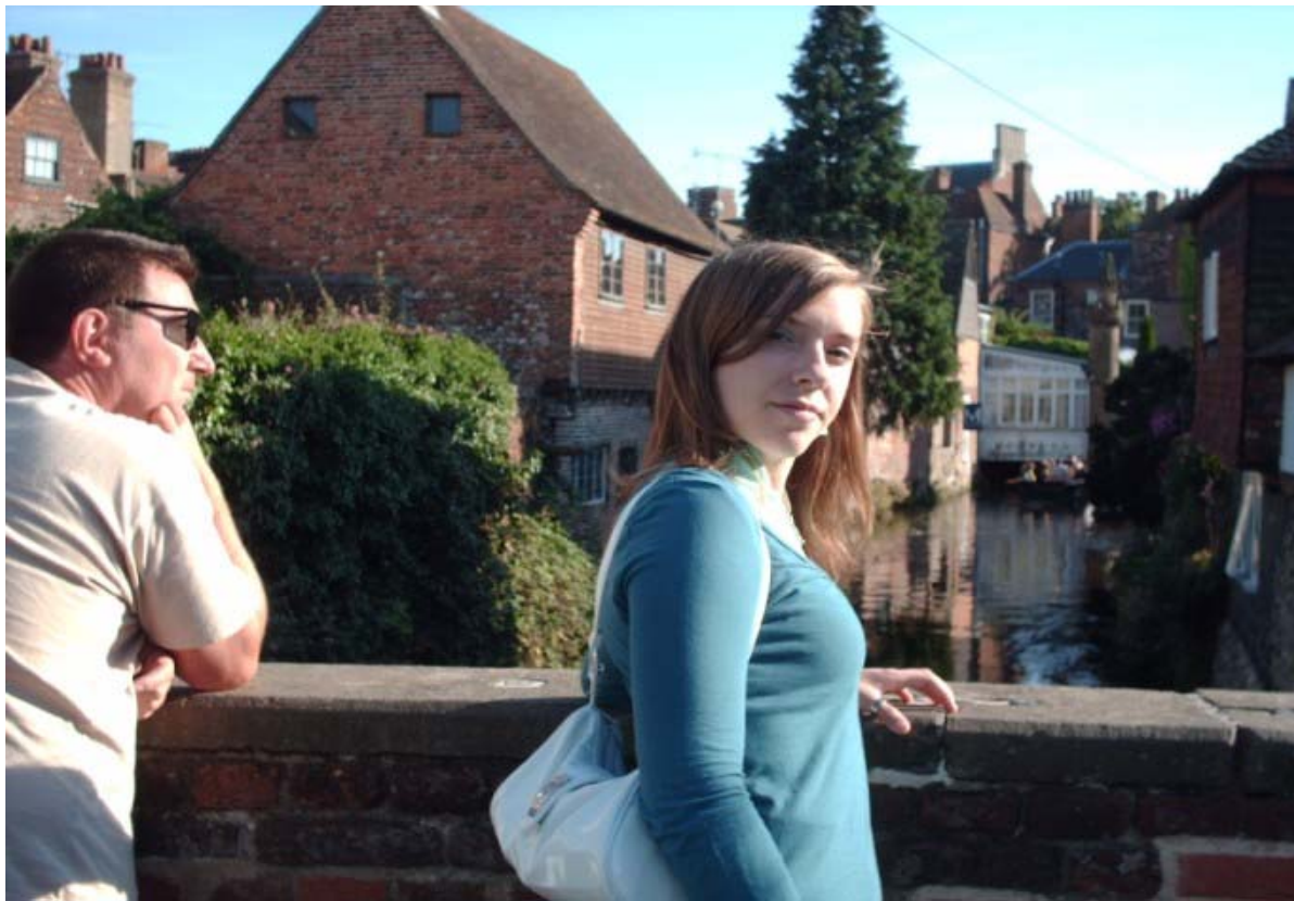
Rochester , mú cuco él..