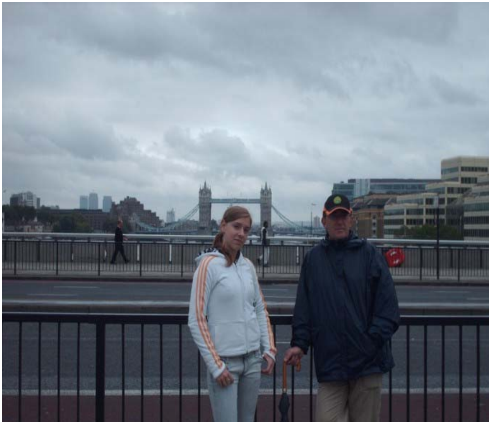
Este sí es el London Brigde