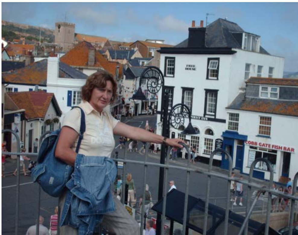
Lyme Regis, Dorset