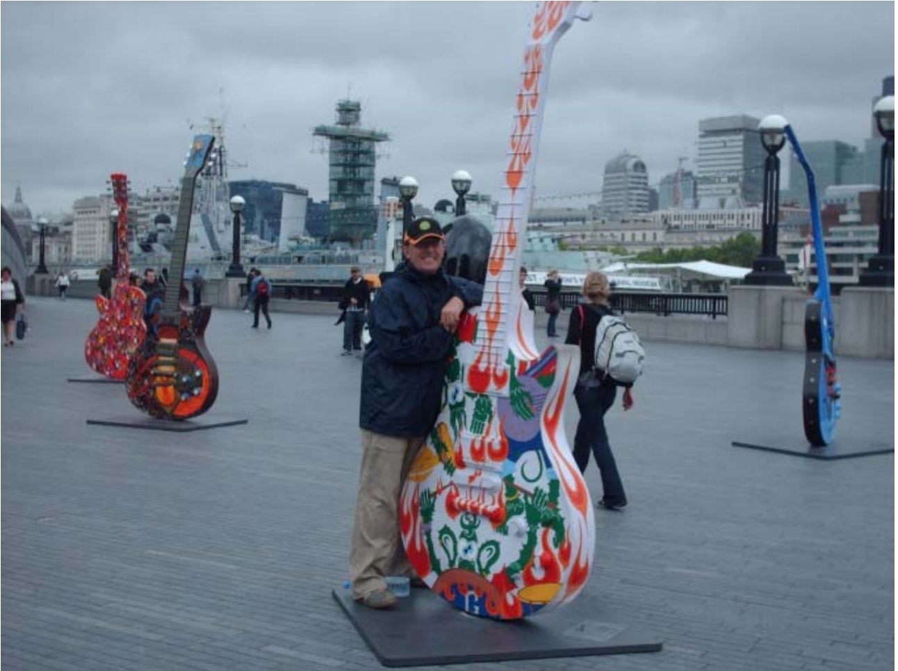
Porrón de museos, y mas museos...