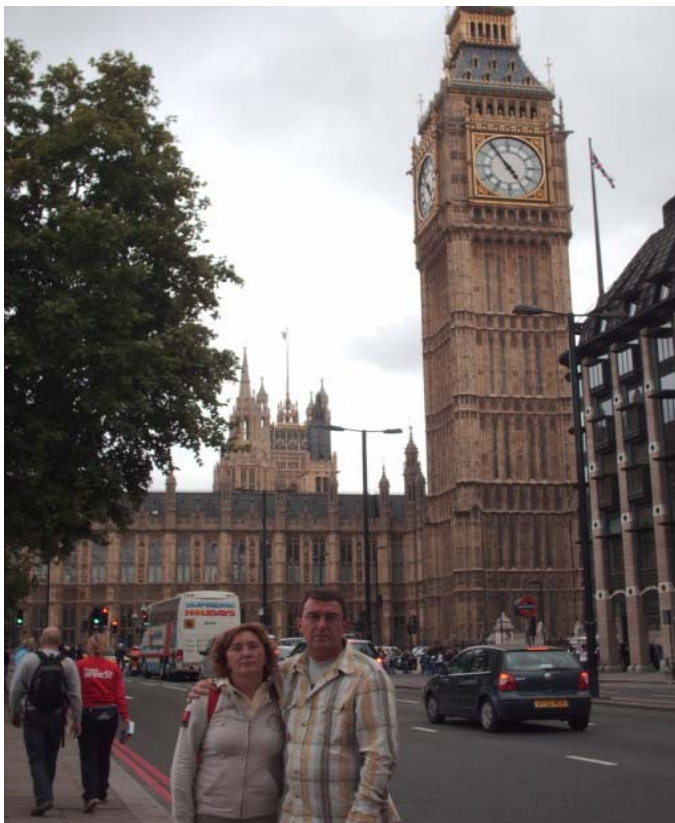
Big Ben, faltaría más