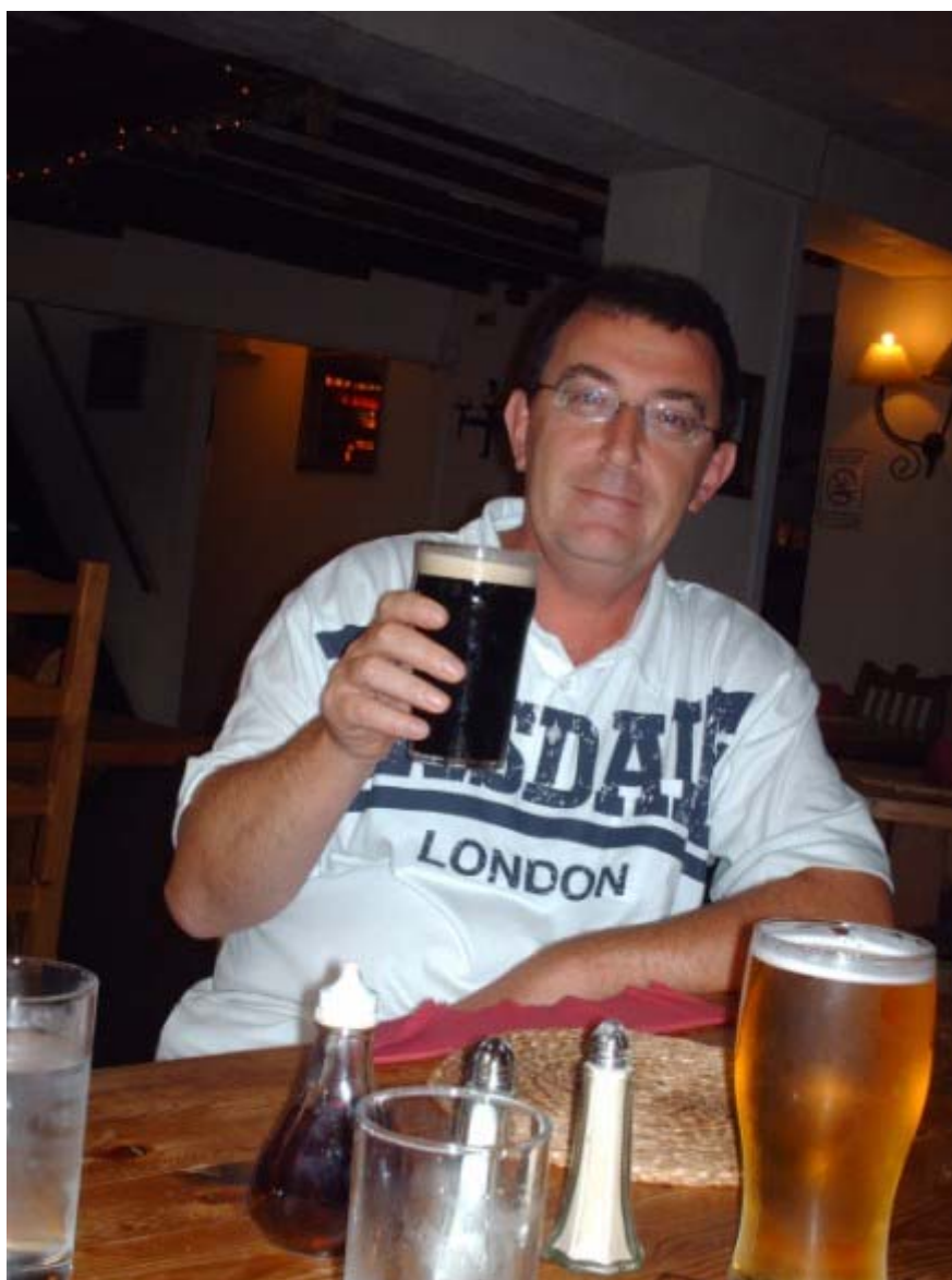
Foto Pub con un par de pintas de Guinness